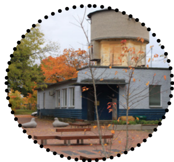
Keila raudteejaama väljak Maarja Tüür, 2018