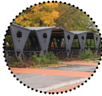
Jalgrattaparklad raudteejaama väljakul Maarja Tüür, 2018