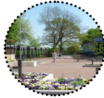
Raudteejaama väljak Inge Angerjas