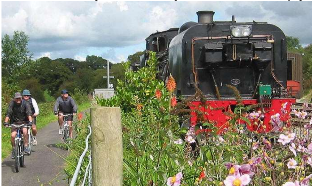
Foto 117. Lon Eifioni jalgrattarada Walesis.

oluline turvalisuse tagamine nii ülekäigukohtadest kui neist väljaspool.