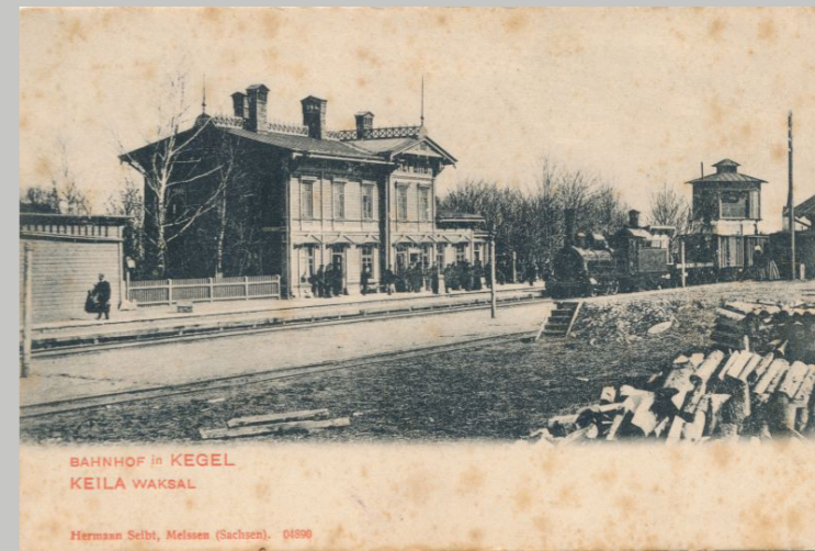
Raudteejaam enne I MS Harjumaa muuseum