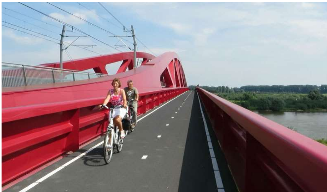
Foto 116. Raudtee- ja kergliikluse sild Zwolles Hollandis.

selleks, et inimestel oleks võimalik liikuda rohealade vahel ja linnalähedastele rohealadele jalgsi või kergliiklusvahendiga sujuvalt mööda haljastatud koridore, kus nad puutuvad minimaalselt kokku pideva autoliiklusega. Ökoloogiline aspekt ei ole primaarne ja on tagatud paralleelse struktuuriga. Samas on puhkeväärtusega rohekoridor inimese kõrval liikumiskoridoriks ka paljudele teistele väiksematele liikidele. Kergliiklejatele rajatavad läbipääsud parandavad tunduvalt Keila erinevate osade omavahelist sidusust. Rajatav läbipääs peab olema turvaline jalakäijatele ja kergliiklejatele ning tagama ka loomadele turvalise liikumise.