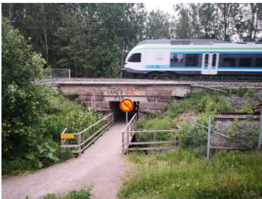
Foto 118. Raudtee alt läbikäiguks kohaldatud truup Leppävaaras, Soomes.

Probleemiks ja konfliktikohaks on ülekäigud raudteest. Võimalikke konfliktikohtade lahendusi on käsitletud konfliktikohtade analüüsis ptk ning neile tuleb leida lahenduses koostatavas üldplaneeringus koostöös Eesti Raudteega.