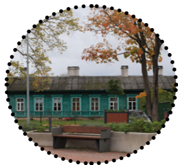
Ajalooline raudteetöölise elamu Maarja Tüür, 2018