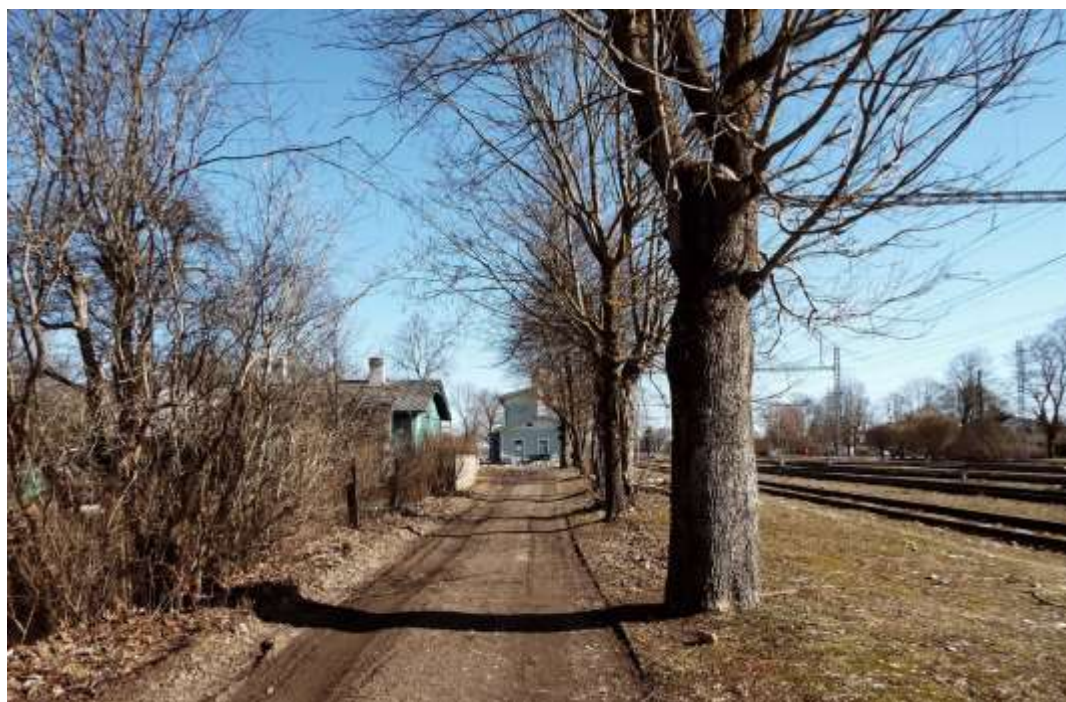
Foto 115. Tihedas kasutuses olevad jalgrajad raudtee kaitsevööndisse kuuluval alal.

Raudtee koridoris kasvab mitmekesist, valdavalt lehtpuudest ja põõsastest koosnevat haljastust ja selle ääres paiknevad linnaelanike poolt kasutatavad teerajad. Raudtee kaitsevööndi haljastus koos teeradadega moodustab omamoodi puhkeotstarbelise koridori läbi Keila linna, mis rajatise kaitsevööndi tõttu on kohati suhteliselt lai ja paikneb mõlemal pool raudteed. Alasid on kohati kasutatud ka linnaaianduseks. Teeradade planeerimisel raudteekoridori on võimalus elanike jaoks ühendada Niitvälja/ Tammiku tee looduslikud alad ja Keila mõisapark ning moodustada nii oluline rekreatiivne koridor). Harju maakonnaplaneeringut täpsustavas teemaplaneeringus „Harjumaa kergliiklusteed“ on raudtee äärde planeeritud maakonna tasandi kergliiklustee.