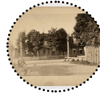
Vaade jaamahoonele 1920. aastatel Gustav Kulp, Harjumaa Muuseum