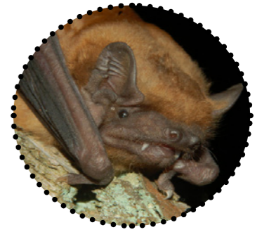
Suurvidevlane (II kaitsekategooria)