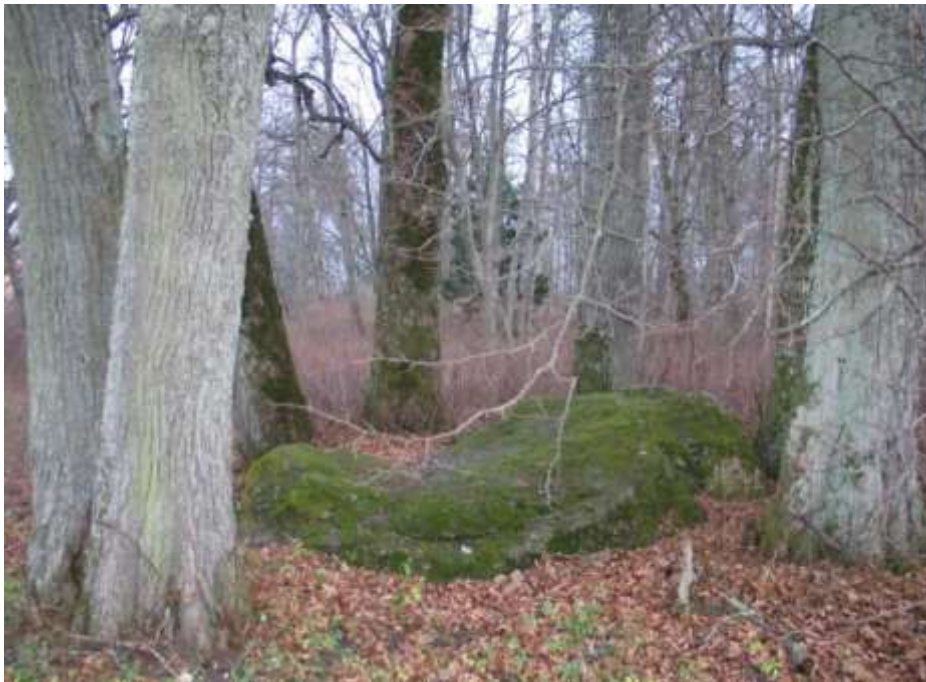
Foto 1. Vaade Orjakivile (kultuurimälestise nr 17882), mis asub Keila jõe saarel, Keila mõisa pargi südames. Jõepargis asuv rändrahn on madal asemekujuline tugevasti murenenud viiburgiitrahn. Mõõtmed: pikkus 3,8 m, laius 2,5 m, kõrgus 0,8 m, ümbermõõt 10,4 m. Rahnu ümber kasvab seitse põlist pärna (Keppart, 2013).

Inimasustuse vanimad jäljed Keilas ulatuvad nelja või viie tuhande aasta taha (Kaljusaar, 1997). Muinasaja vanimaks säilinud mälestiseks on Keila mõisapargi territooriumil asuv Orjakivina tuntud kultuskivi (hiljemalt 1. aastatuhandest), millesse on uuristatud lohukesed (vt Foto 1).