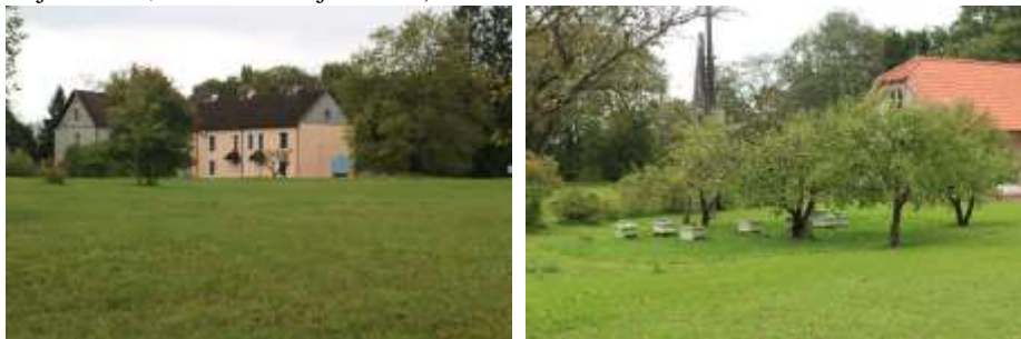
Foto 22 ja 23. Vaade Keila mõisa peahoonele aastast 2018. Peahoone paikneb avatus maastikus, hoone tagusel alal paikneb mesitarudega viljapuuad.

Alates 1995. a. haldab Keila mõisahoonet Kultuuriministeerium, tänapäeval asub mõisa peahoones Harjumaa Muuseum. Muuseumihoone lähistel on säilinud karjakastelli vundament (vt ka Pargi kujunemine, fotod Foto 3 ja Foto 4).