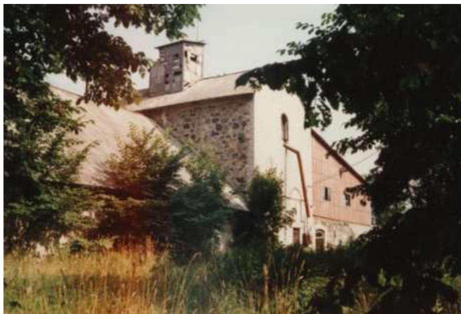
Foto 8. Vaated Keila mõisa viinavabrikule, mis on tänaseks varemeis ja paiknes peahoonest teisel pool jõge. Viinavabrikuni viis sild üle jõe.

Keila jõgi on Keila mõisa ajaloos olnud väga olulisel kohal – oluliseks sisstulekuallikaks on olnud kalapüük ja kalakasvatus, mille tiigid asusid mõisapargi alast veidi eemal lääne pool. Jõe kaldal on asunud mitu veskit, sealhulgas ka saeveski.