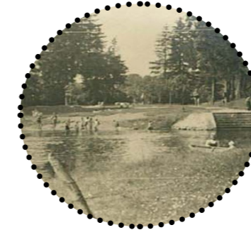
Punane Vähk Harjumaa Muuseumid