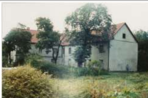
Foto 6. Vaated Keila mõisa peahoonele 20. sajandi alguses. (foto allikas: Harjumaa Muuseum HMK _ F 362 ja HMK _ F 3552).

Arvukad Keila mõisa kõrvalhooned paiknesid peahoonest enamikus osas põhja pool. Muuseumihoone lähistel on säilinud karjakastelli vundament, linnusest põhja pool on loetav regulaarse tiigi asukoht jne. Osa majandushooneid (nt endine pruulikoda, ehitatud juba 1600-te kesksaiku, moonakatemaja) asetsesid teisel pool Keila jõge.