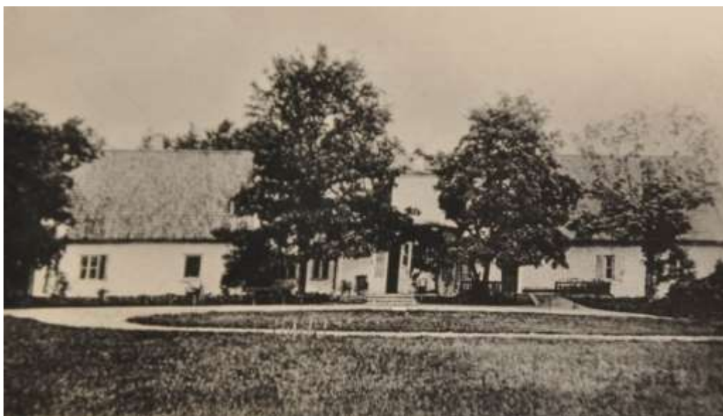
Foto 5. Vaade Keila mõisa peahoonele 19. sajandi lõpul. (foto allikas: Harjumaa Muuseum).

Praegune mõisa peahoone ehitati algselt ilmselt juba 17. sajandil linnusest eemale. Täni säilinud hoone kehand ehitati arvatavasti mõisnik Carl Reinhold von Koskulli ajal 19. sajandi alguses (1802.a). Algselt oli peahoone põhimahus ühekordne, ainult hoone keskosa oli kahekordne, millel omakorda madal väljaehitus peasissekäiguga. Hoonet ehitati ümber korduvalt 19. sajandil. Praegune katuselahendus ja täismahus teine korrus on jäljed 20. sajandi (põhiosa 1905.a. erinevatest ümberehitustest).