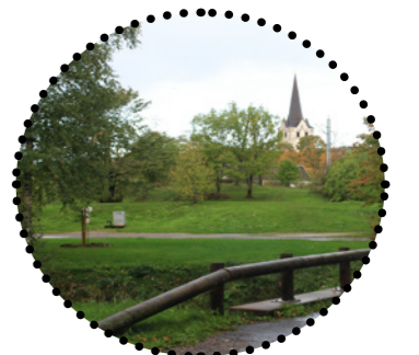
Vaade taastatud kivisillalt kesklinna suunas Foto: Maarja Tüür, 2018