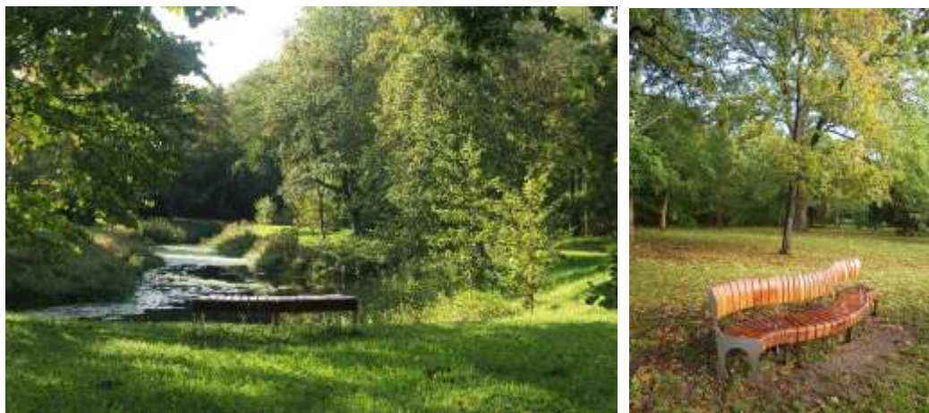
Foto 25 ja 26. Vaated pargis paiknevatele pinkidele.