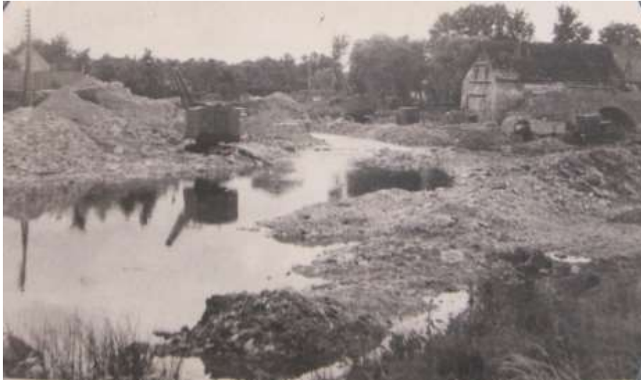
Foto 12. Vaade Keila jõesängi kaevamisele.

Mõisa park oli algselt väga omanäolise kujundusega – põhirõhk oli arvukatel tiikide-kanalite-saarte-poolsaarte süsteemil ( Angerjas, 2013 ). Tiikide rajamise eesmärk oli niiskete alade kuivendamine kui ka kalakasvatus. Keila jõe süvendamisega 1960-61.-tel aastatel esialgne kujundus hävis ning tiikide kaotamisega kaotas park oma veepeeglid ( Kivisilla OÜ, 2015 ). Veskitamm lammutati, voolusäng kaevati kohati sirgemaks, mõisapargis peatati veevool just selles jõeharus, mille äärde jäi Punane Vähk ja Paradiis ( Palamets, 2017 ). Sinna moodustus seisva veega tiikide ahel ning supluskohana sai kasutada siis veel pealtvoolu jäänud Patsakut ( Palamets, 2017 ).