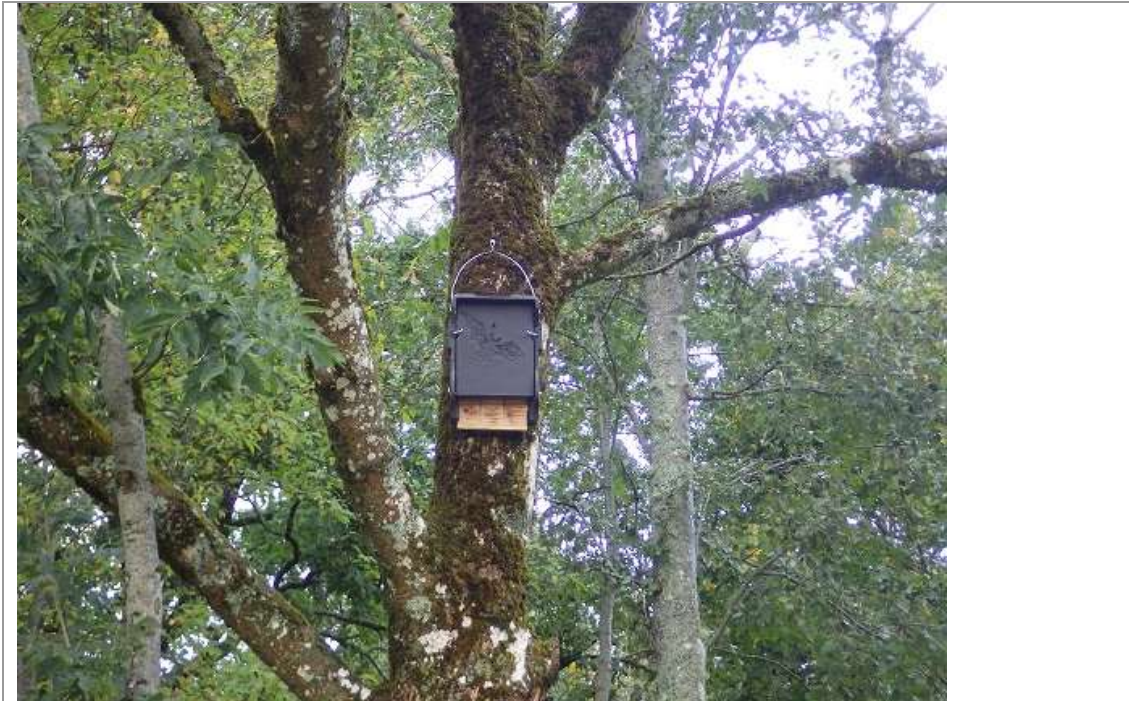
Foto 24. Vaade nahkhiire varjekastile.