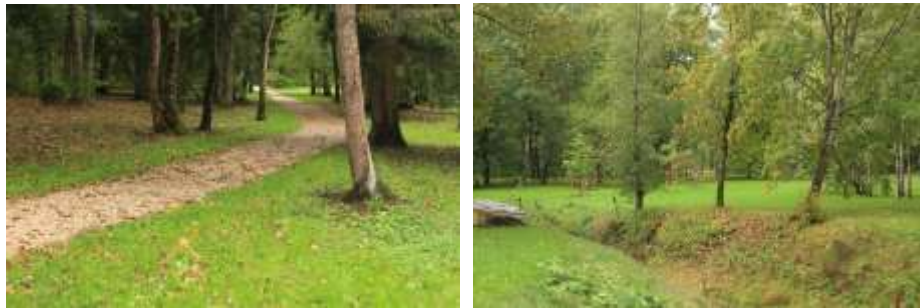
Foto 15 ja 16. Vaated Keila mõisa pargis paiknevale sõelmeteele ja nõvale.

Kalatiikidest edasi viib tee endise ujumiskohani „Punane Vähk”. Tee vastaskaldal on säilinud kivist trepp, mida mööda mindi jõkke ujuma, samuti paiknevad ujumiskoha juures istepingid ja infotend. „Punasest Vähist“ viib pargitee edasi järgmise endise ujumiskohani „Paradiis”. „Paradiisist“ läheb pargitee edasi endise jalakäijate silla asukohani. Sillalt avanevad vaated piki jõge ja ka silla juures kasvavatele põlistele tammedele (OÜ Kivisilla, 2015). Järgmine „jõetee“ peatuspunkt on „Tõllaaugu“ juures, kus avanevad vaated veepeeglile ja endiste nõvade/kraavide süsteemile. „Tõllaaugu“ lähistel asuvad kalameeste populaarsemad õngitsemiskohad.