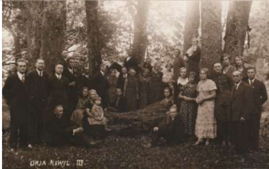
Foto 2. Keila Põllutöökooli õpilased Orjakivil 20. saj alguses.

Võimalik, et 13. sajandi alguses hakkas soodsa kaitseasendiga Keila jõe saarele kujunema kindlustatud valduskeskus ( Varep, 1948 ). Linnuse varemed avastas 1976. aastal ajaloolane H. Gustavson ning järgneval aastal teostatud arheoloogilistel uuringutel kaevati välja ruudukujuline torniosa ning sellega liituv ümar apsiid, lisaks avastati 1-3 meetri paksuste seintega eluhoone säilmed ning müürifragmente mitmetest kõrvalehitistest ( Kultuurimälestiste riiklik register: https://register.muinas.ee/ , vt Foto 3 ). Uuringute tulemusel tõestati, et ordulinnus eksisteeris 15.-16. sajandil, kuid hoone intensiivne kasutamine kestis veel hilisemal perioodilgi. Ilmselt kasutati linnust veel 18. sajandi lõpulgi, sest tollases S. Dobermanni koostatud mõisakirjelduses märgitakse uues puust härrastemaja kõrval ka vana kivist elumaja. Lisaks loetles Dobermann ka tolleaegseid mõisa majandusehitisi, kuid kahjuks ei sisalda kirjeldus midagi pargi kohta ( Hein, 1980 ).