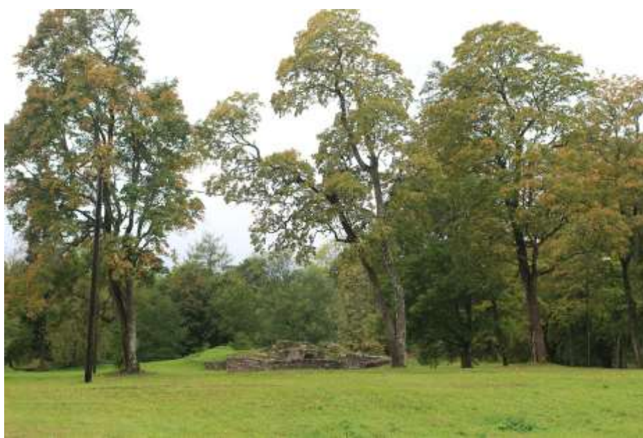
Foto 3. Vaade väikelinnuse e kastelli varemetele Keila mõisapargis (mälestise reg. nr. 21517 Keila kindlustatud elamu). Linnusest on säilinud vaid alusmüürikatete näol).