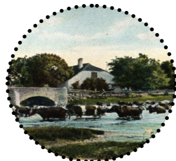
Hävinud kivisild (endine mõisa peasissepääs) Harjumaa Muuseumid