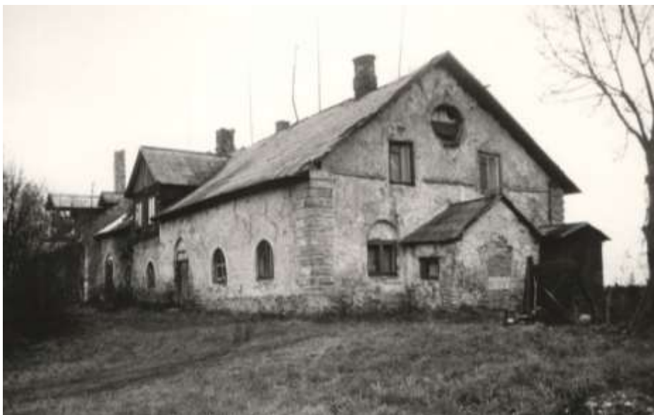
Foto 7. Vaade Keila mõisa moonakatemajale aastast 1980, mis paiknes peahoonest teisel pool Keila jõge.

Arvukad Keila mõisa kõrvalhooned paiknesid peahoonest enamikus osas põhja pool. Muuseumihoone lähistel on säilinud karjakastelli vundament, linnusest põhja pool on loetav regulaarse tiigi asukoht jne. Osa majandushooneid (nt endine pruulikoda, ehitatud juba 1600-te kesksaiku, moonakatemaja) asetsesid teisel pool Keila jõge.