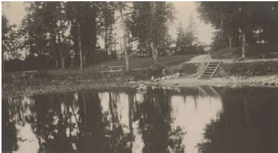
Foto 11. Vaade Keila jõe äärsele linnaelanike meelis-supluspaigale Punane Vähk.