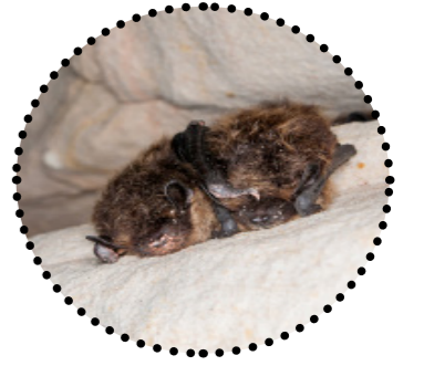
Põhja-nahkhiir (II kaitsekategooria)