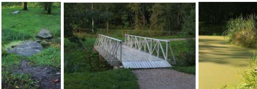
Foto 19, 20 ja 21. Vaated Keila mõisa pargis paiknevate kiviastmetele üle nõvade, jalakäijate sillale ja veerohkele tiigile.

„Tõllaaugust“ viib jõega paralleelselt pargitee ujumiskohani „Ostrovka”, mida kasutatakse aktiivselt supluskohana ka tänapäeval. Supluskoht „Ostrovka“ juurest järgib pargitee endise jõekaaru hobuserauakujulist joont ja viib edasi mõisa kagupoolsele avatud pargiaasale, mis jääb Harjumaa Muuseumi territooriumile.