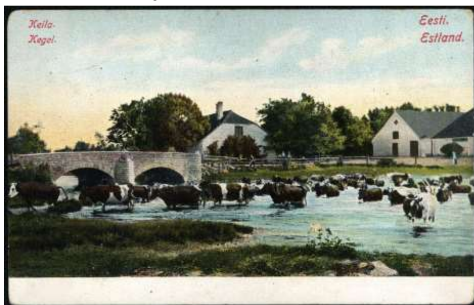
Foto 9. Vaated Keila mõisa juures üle jõe viivale sillale.

Keila jõgi on Keila mõisa ajaloos olnud väga olulisel kohal – oluliseks sisstulekuallikaks on olnud kalapüük ja kalakasvatus, mille tiigid asusid mõisapargi alast veidi eemal lääne pool. Jõe kaldal on asunud mitu veskit, sealhulgas ka saeveski.