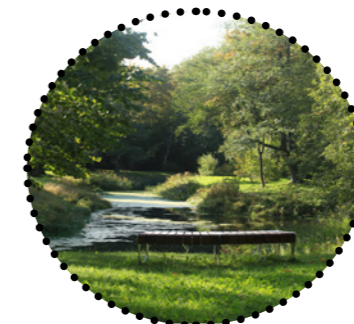
Supluskoht Paradiis