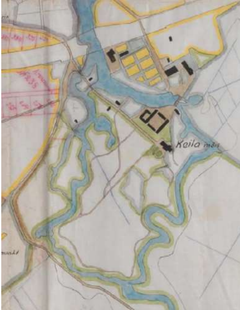
Foto 14. Keila alevi ja ümbruse plaan. 1920.