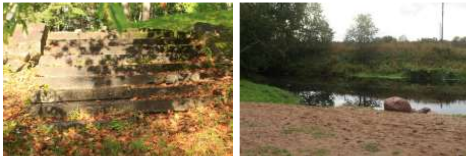
Foto 17 ja 18. Vaated Keila mõisa pargis paiknevate ujumiskohtadele: trepp ujumiskohas „Punane vähk“ ja liivane kaldariba ujumiskohas „Ostrovka”.

Kalatiikidest edasi viib tee endise ujumiskohani „Punane Vähk”. Tee vastaskaldal on säilinud kivist trepp, mida mööda mindi jõkke ujuma, samuti paiknevad ujumiskoha juures istepingid ja infotend. „Punasest Vähist“ viib pargitee edasi järgmise endise ujumiskohani „Paradiis”. „Paradiisist“ läheb pargitee edasi endise jalakäijate silla asukohani. Sillalt avanevad vaated piki jõge ja ka silla juures kasvavatele põlistele tammedele (OÜ Kivisilla, 2015). Järgmine „jõetee“ peatuspunkt on „Tõllaaugu“ juures, kus avanevad vaated veepeeglile ja endiste nõvade/kraavide süsteemile. „Tõllaaugu“ lähistel asuvad kalameeste populaarsemad õngitsemiskohad.