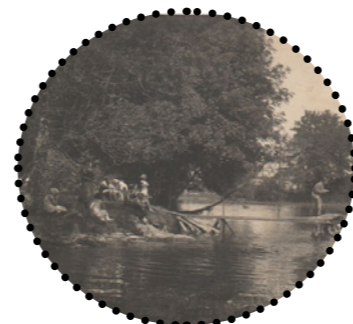
Supluskoht Keila mõisa pargis Harjumaa Muuseumid