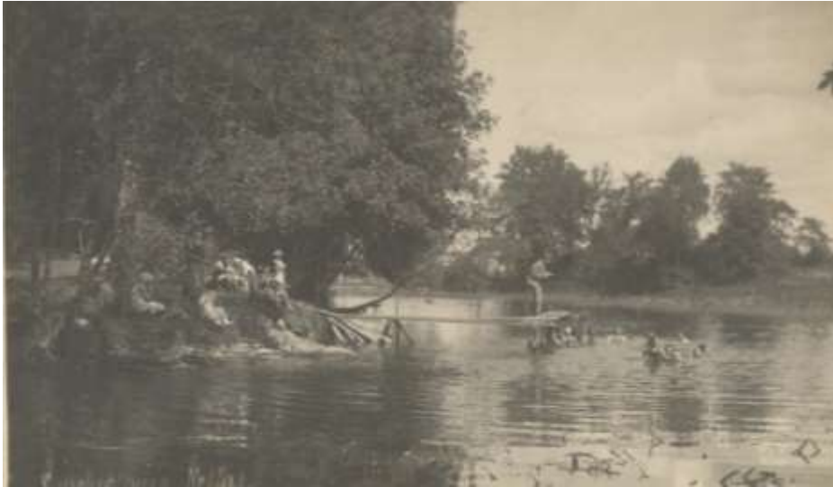
Foto 10. Vaade Keila jõe äärsele supluspaigale – foto aastat 1920-1930.