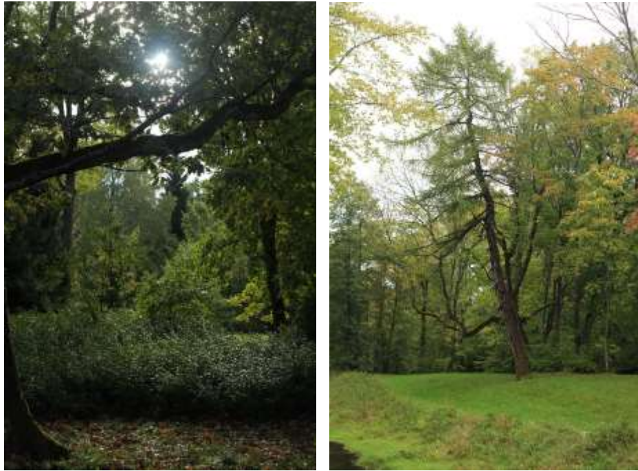
Foto 27 ja 28. Vaated pargi imposantsele haljatusesele, kus säilitati vana põdsarinnet ja avati vaated dominantsetele vanadele puudele.

Restaureerimisprojektiga on pargi liigirikkust oluliselt suurendatud: pargis täiendati põdsarinnet ja istutati okaspuuid. Liikide valikul lähtuti ajalooliselt Eesti mõisaparkides kasvanud puudest ja põdsastest.