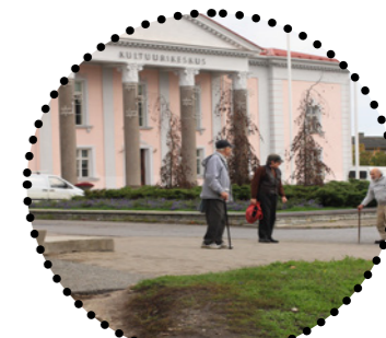
Keila Kultuurikeskus Maarja Tüür, 2018