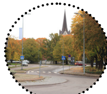
Vaade Kuuse ja Pärna parkidele Maarja Tüür, 2018