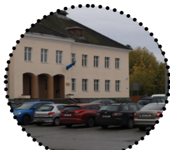
Erakooli Läte esine parkla Maarja Tüür, 2018