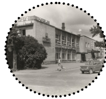
Kauplus "Keila" Harjumaa muuseum