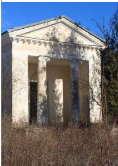
Foto 51 Väana mõisa kabel Keila kiriku aias