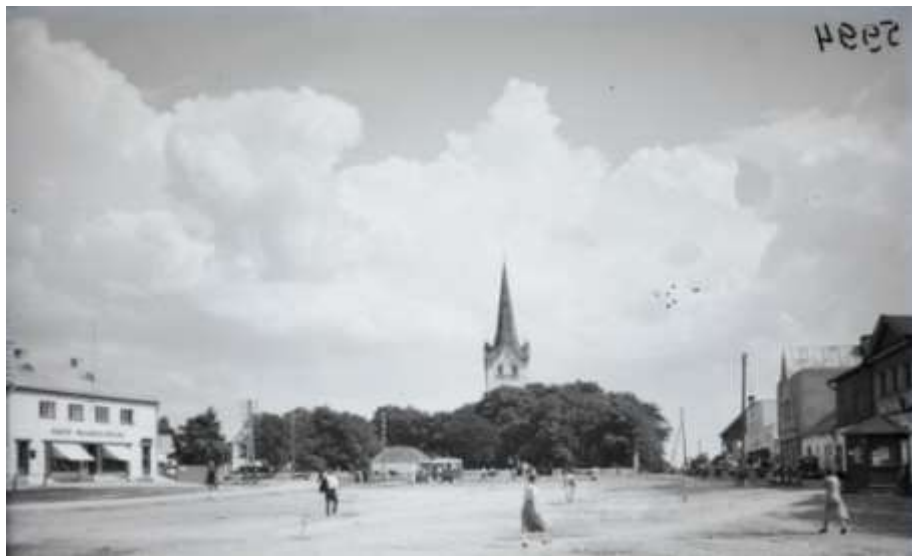
Foto 47. Vaade ida-lääne suunalisele avatud Keila Kirikuplatsile 1930.-test aastatest (täna alal Pärna park, lõuna pool Kuuse park) (foto allikas: Eesti Ajaloomuuseum AM N 5994).

Kui Haapsalu maantee sai osaliselt munakivisillutise seoses tsaariperekonna troonijuubeliga juba enne esimest maailmasõda, siis Kirikuplatsi korrastamiseni jõuti alles Eesti ajal ( Angerjas, 2013 ). Väljak sai kivisillutise ja sillutustöödest üle jäänud muld kanti kirikuesisele muruplatsile ja kujundati sellest kolmnurkne haljasala, mille igasse nurka istutati pärn ( Angerjas, 2013 ). Sellest on saanud ka haljak oma nimetuse – Pärna park. 1. mail 1938. aastal sai Keila alevist linn ning linnaõiguste andmist tähistati pidulikult Kirikuplatsi kolmnurkse platsi keskele tamme istutamisega, mis on praegugi mälestustahvliga tähistatud ( Angerjas, 2013 ). Kuuse park on rajatud juba enne II Maailmasõda, kus kasvab ka Keila linna jõulukuusk ning kuhu põhja- ja lõunapoolsesse külge istutati sümmeetrilised puuderivid.