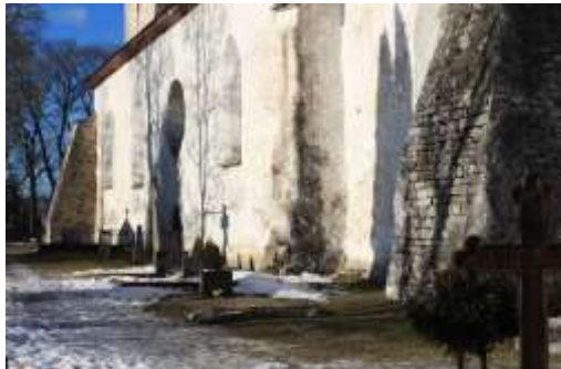
Foto 44. Keila kiriku aed 2019