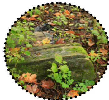
Põõsastes varjul olevad hauakivid