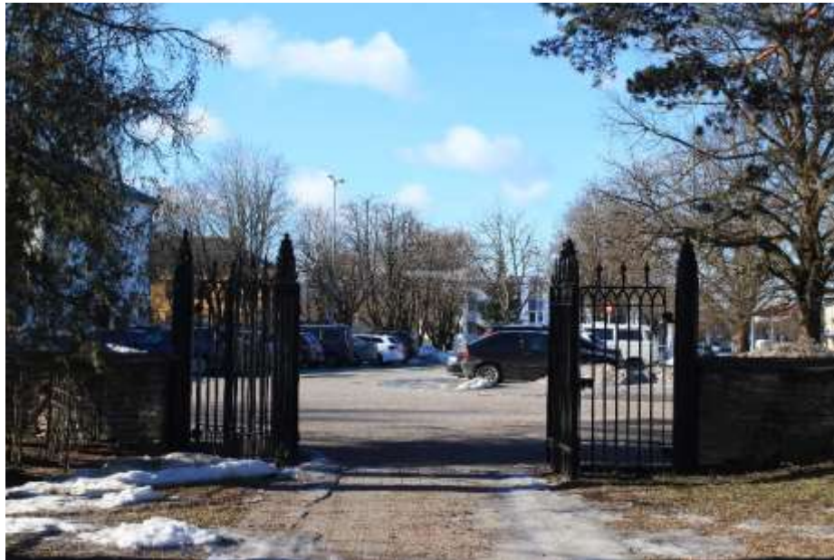
Foto 52 Vaade kirikuaiaist Kiriku platsile, kus asub praegu koha väärkusega mitte sobiv parkla.

Keila linna üldplaneeringu raames läbi viidud küsitlustest selgus, on Keila kirik ja kirikuaed on elanikele olulise tähtsusega. Kirikuaias käiakse jalutamaks, seal toimuvad kontserdid. Elanikud imetlevad kirikuaia põlispuid ja kiriku ümbruses kasvavaid roose. Kirikut, kirikuaeda ja kirikuplatsi nimetati teise vaatamisväärsusena Keila mõisapargi järel, kuhu viiakse oma külalisi Keila linnaga tutvumiseks. Väärtustatakse kirikule ja kirikutornile läbi linna ja eemalt avanevaid vaateid („linna sisse sõites on kirik igast küljest vaadeldav“, „Kesklinnast avaneb vaade kirikule -sh tänavatelt; Keskpargi kastanite alleelt“). Kokkuvõttes on Keila kirik elanike jaoks Keila linna sümbol ja linna identiteedi kandjaks („Üks asi, mis mulle Keila puhul meeldib, et kui koju sõita, paistab kirik kaugelt!“).