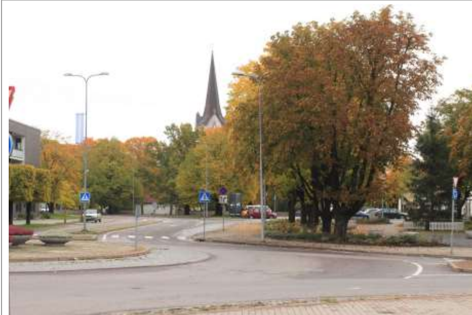
Foto 53. Vaade Kuuse platsile ja Pärna platsile Keila Linnavalitsuse hoone poolt koos esiplaanil domineeriva ringristmikuga ja tagaplaanil paikneva autoparklaga Kirikuplatsil.