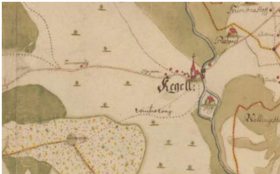
Foto 45. Vaade Keila linna hõlmavale plaanile Kelgell Sochn 17. saj II poolest, kus stiliseeritud leppemärkidega on eristatud mõisasüda, kirik, talukohad kujutatud punktadena.

1730. aastatel rajati Paldiski maantee ( Raam, 1997 ). 18. sajandil sai postimaanteeks Keilat läbinud ajalooline teetrass Tallinn–Haapsalu (Tallinna–Haapsalu postimaantee), mille algusaja võib oletatavasti paigutada 13. sajandi esimesse poole. 1797. aastal ehitati kirikust Tallinna poole ühe kilomeetri kaugusele jääv uus pastoraadihoone, mis kirikumõisate seas oli erandlikult kahekorruseline.