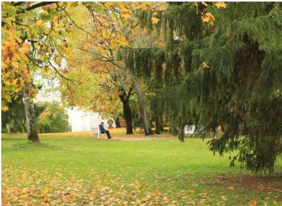
Foto 59. Keskpargi vaade 2018. a. sügisel. Taamal mälestusrist.

Keskpark kui endine kalmistu oli pigem eraldiseisev ja suletud süsteem eramajade vahel ( Lootusprojekt OÜ, 2018 ). Samas kasutatakse ala läbipääsu-, jalutamise- ja puhkamiskohana, kust viivad läbi teed linna oluliste objektideni. Olulisem vaade pargile avaneb ala lääneosast piki kastanialleed, kastaniallee otsast avaneb vaade ka Keila kirikule.