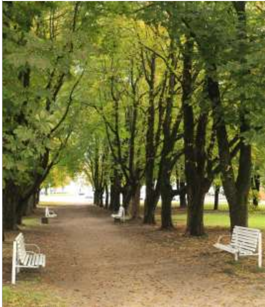
Foto 58 Kastaniallee Keskpargis 2018. a. sügisel