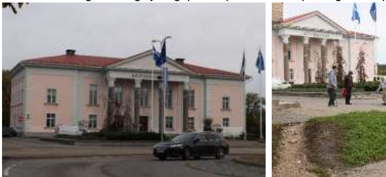
Foto 54 ja Foto 55. Vaated Kultuurikeskuse hoonele ja selle esisele haljasalale.