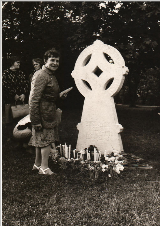
Mälestusristi avamine end. Keila kalmistul, 1991