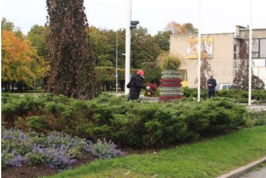
Foto 57. Vaade Kultuurikeskuse esisele värvikale haljasalale.

okaspuuvorme, rajati erinevatel aastaegadel silmailu pakkuvad põõsaste-ning püsi-, sibul- ja suvelilledega peenrad.