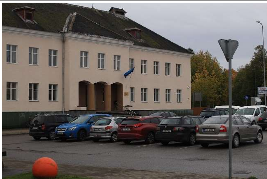
Foto 56. Vaade endisele Keila rajoonikomitee (haigla) hoonele, mille ees paikneb ulatuslik parkla. Praegune waldorfskool "Läte".

Keila üldplaneeringus toodud küsitluste alusel nimetati Kuuse parki kui meeldivat roheala "...linna keskel, kus on hea istuda ja vaadata sagivat linna" ning leiti, et sellised väiksemõõtmelised istumist võimaldavad haljasalad rikastavad linnapilti.