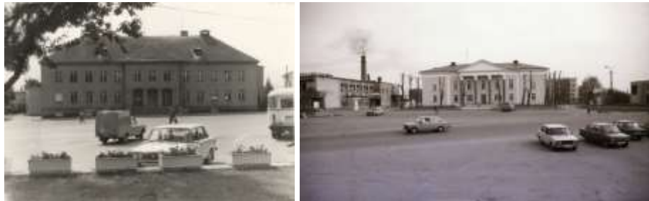
Foto 49 ja Foto 50. Vaade Keila Keskväljakule 1990.-tel aastatel.