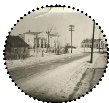
Vaade Haapsalu mnt.-lt kultuurimajale 1956 Harjumaa muuseum