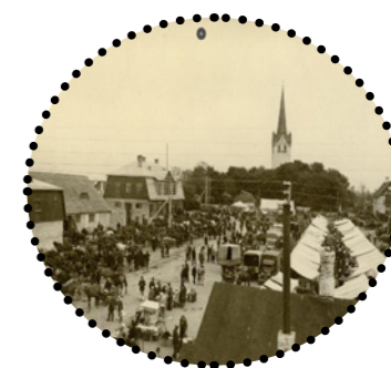
Laat Keila kirikuplatsil, 1933