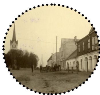
Kiriku plats, paremal võõrastemaja Keila, 1930. aastad