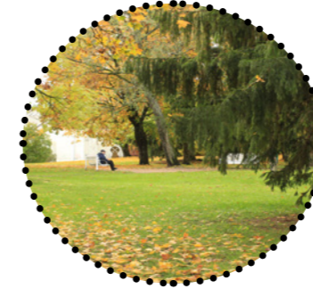
Keskpargi vaade rõngasristiga