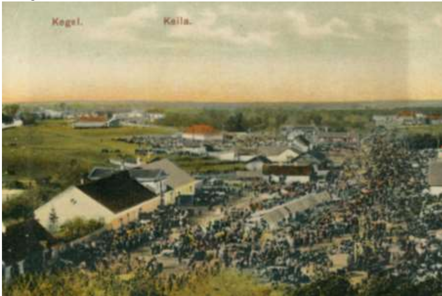
Foto 46. Vaade Keila Kirikuplatsile (täna ka Pärna park, Kuuse plats) aastast ca 1910.

19. sajandi esimeses veerandis jäi kirikuaed kalmistuna kitsaks ning 1823. aastal rajati uus surnuaed Haapsalu ja Paldiski maantee vahel täna Keskparki (likvideeriti 1966) (Kaljusaar, 1997). Tänapäevase välimuse sai kirik 1851. aastal.