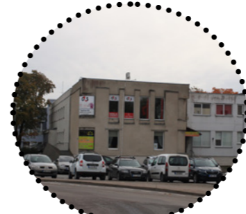
Teenindushooned Keskväljaku ääres Maarja Tüür, 2018