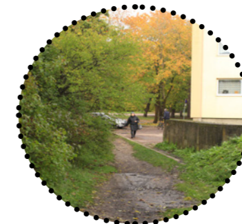
Vajalik, praegu ebamugav kergliikluse läbipääs Männiku pargi suunal