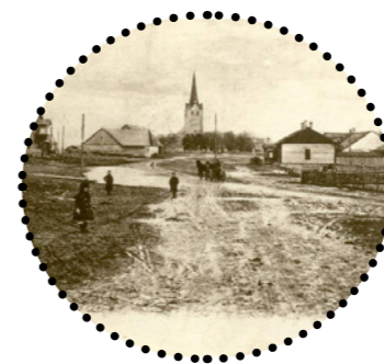
Kiriku plats 1920. aastal