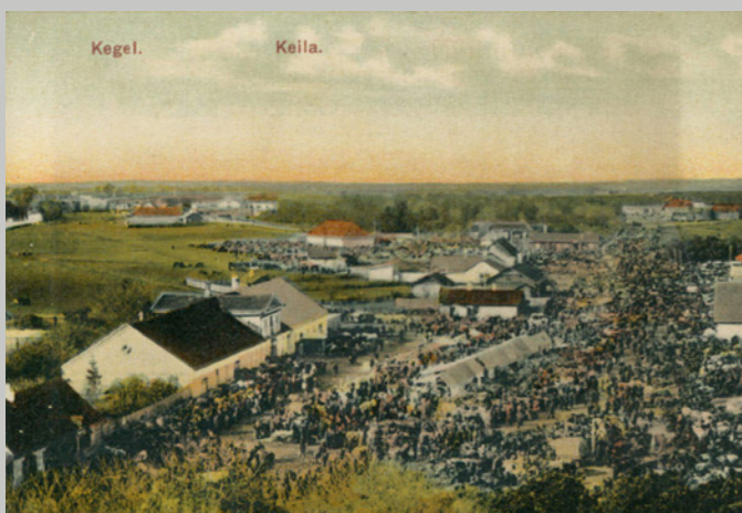
Vaade Keila kiriku tornist kiriku platsil toimuvale laadale, 1910? Harjumaa Muuseum